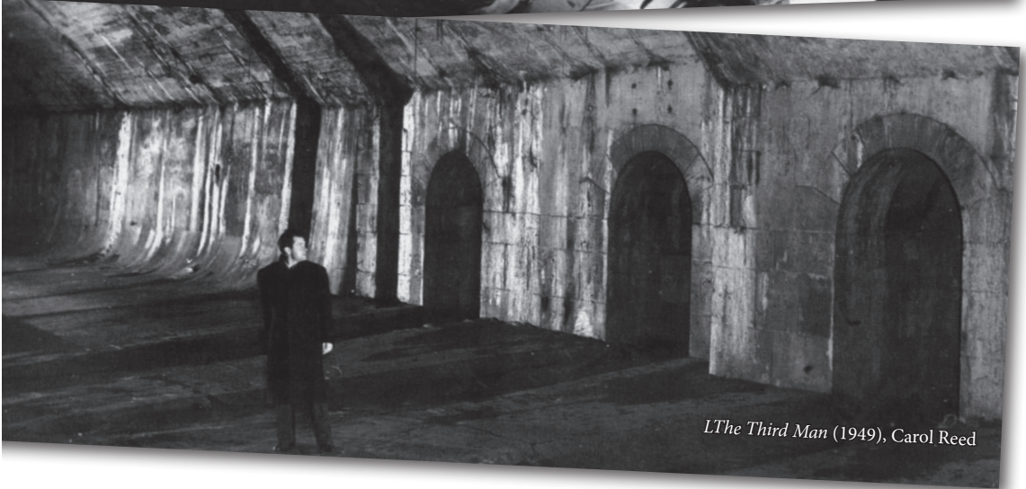
The Third Man (1949), Carol Reed