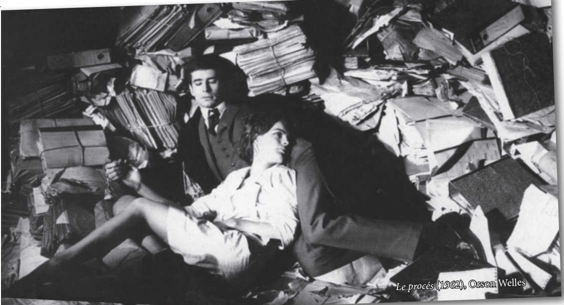
Le procès (1962), Orson Welles