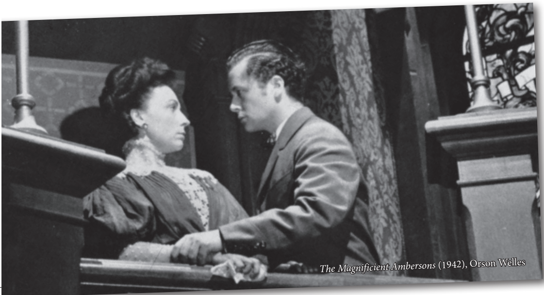
The Magnificent Ambersons (1942), Orson Welles

El seu debut com a realitzador amb només 26 anys és enlluernador. Citizen Kane ( Ciudadano Kane , 1941) és una de les pel·lícules transcendents de la història del cinema. Al llarg del film podem observar que Welles posseeix un coneixement culte i sibarita de les pel·lícules realitzades en diverses cinematografies al llarg del temps. En aquest coneixement es basa a l'hora d'abordar les diferents decisions tècniques i estètiques que tant van sorprendre en la seva estrena. Per poder dur a terme aquest projecte intel·lectual, es va recolzar en la saviesa del director de fotografia Gregg Toland i del guionista Herman J. Mankiewicz. La pel·lícula no va obtenir l'acollida esperada i els seus projectes següents no van gaudir del suport de les productores.