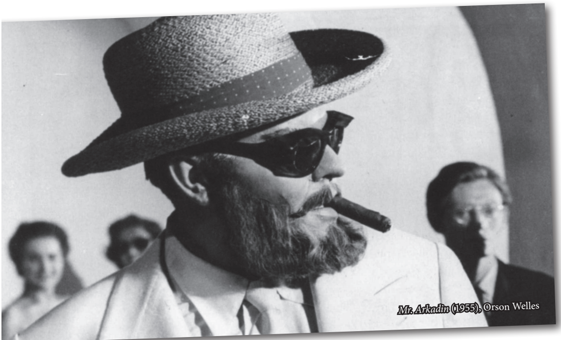
Mr. Arkadin (1955), Orson Welles

Un inspector de policia segueix la pista d'un criminal nazi establert als Estats Units després de la guerra. Les seves investigacions el porten a sospitar d'un honorat ciutadà que viu en una petita població de l'interior.