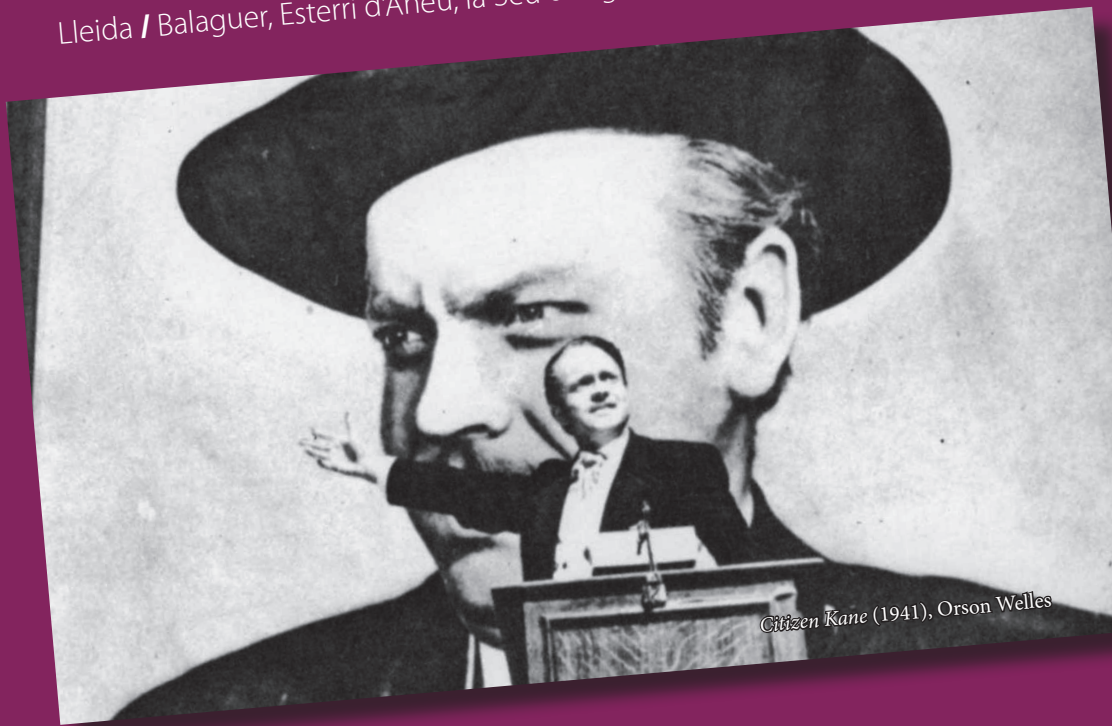
Citizen Kane (1941), Orson Welles

Lleida / Balaguer, Estèrri d'Àneu, la Seu d'Urgell, Mollerussa, Tàrrrega