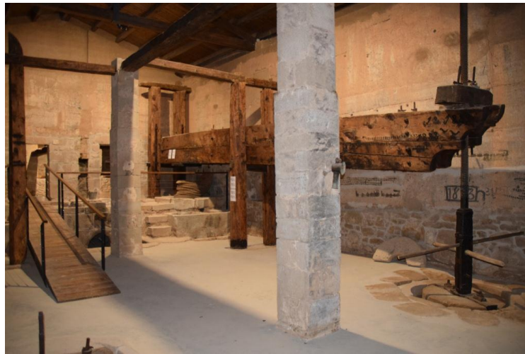
Interior del Molí del Bep del Canut