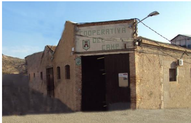
Cooperativa del Camp de Torrebesses