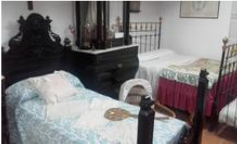
Museu Josep Jané i Periu