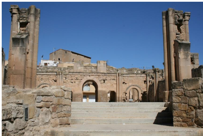
Església Nova de Torrebesses