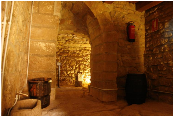
Soterrani del Centre d'Interpretació de la Pedra Seca