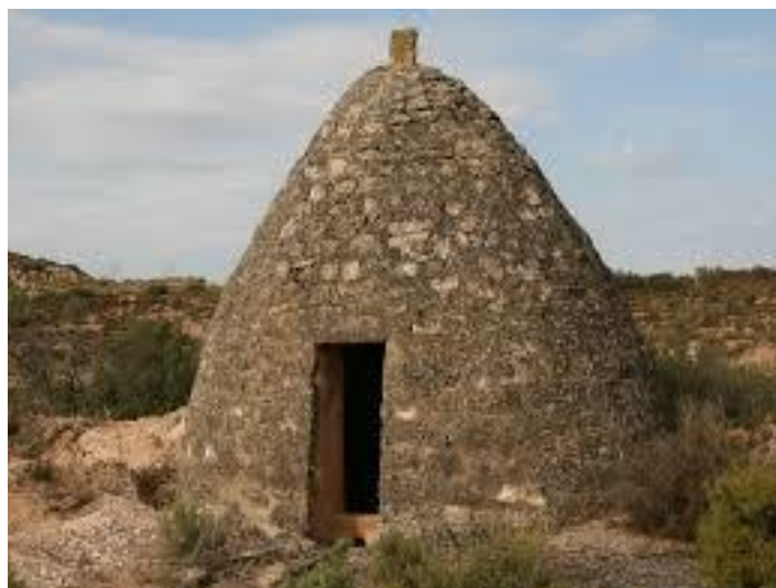
Aljub del terme de Torrebesses