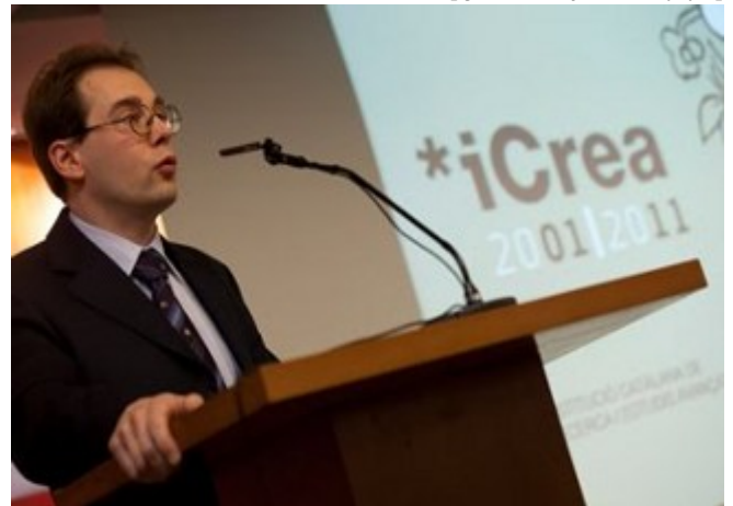
Un dels autors del treball, Cedric Boeckx

/export/sites/universitat-lleida/ca/serveis/oficina/.galleries/docs/documents-premsa/IIPremiJoanSola.pdf