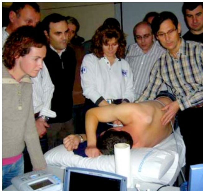
Foto del II Curs d'Ecografia per a Medicina d'Urgències

El Curs d'ecografia per a medicina d'urgències [