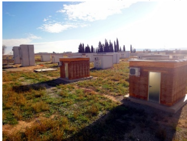
/export/sites/universitat-lleida/ca/serveis/c Estació experimental del GRE a Puigverd de Lleida

La Universitat de Lleida (UdL) acollirà la propera setmana l' Innostock 2012 [ http://www.innostock2012.org/ ], un dels anomenats congressos Stock promoguts per l'Energy Conservation through Energy Storage Implementing Agreement [ http://www.iea-eces.org/ ] (ECES IA) de l' Agència Internacional de l'Energia [ http://www.iea.org/ ] (IEA) que se celebra cada tres anys en una ciutat del món diferent. Les darreres edicions han tingut lloc a Varsòvia, Nova Jersey i Estocolm. Aquest és el primer cop que una ciutat de l'Estat espanyol acull un dels congressos Stock, ja que des del seu inici, al 1981, només s'han celebrat a França, Suècia, Finlàndia, Alemanya, Holanda i Polònia.