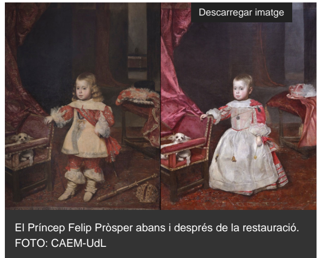
El Príncep Felip Pròsper abans i després de la restauració.