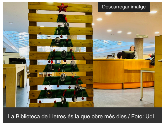
La Biblioteca de Lletres és la que obre més dies

La Universitat de Lleida (UdL) tanca les seues portes al públic durant setze dies aquest Nadal -del 24 de desembre al 8 de gener, ambdós inclosos- per estalviar uns 81.500 euros (57.000€ en energia, 23.000€ en neteja i 1.500€ en comunicacions). Es tracta d'una quantitat "sensiblement superior" a la dels darrers tancaments en aquest període, segons el vicerector d'Infraestructures de la UdL, Narciso Pastor, "per l'encariment de l'energia, especialment del gas". L'estalvi augmenta un 18'97% respecte al 2021.