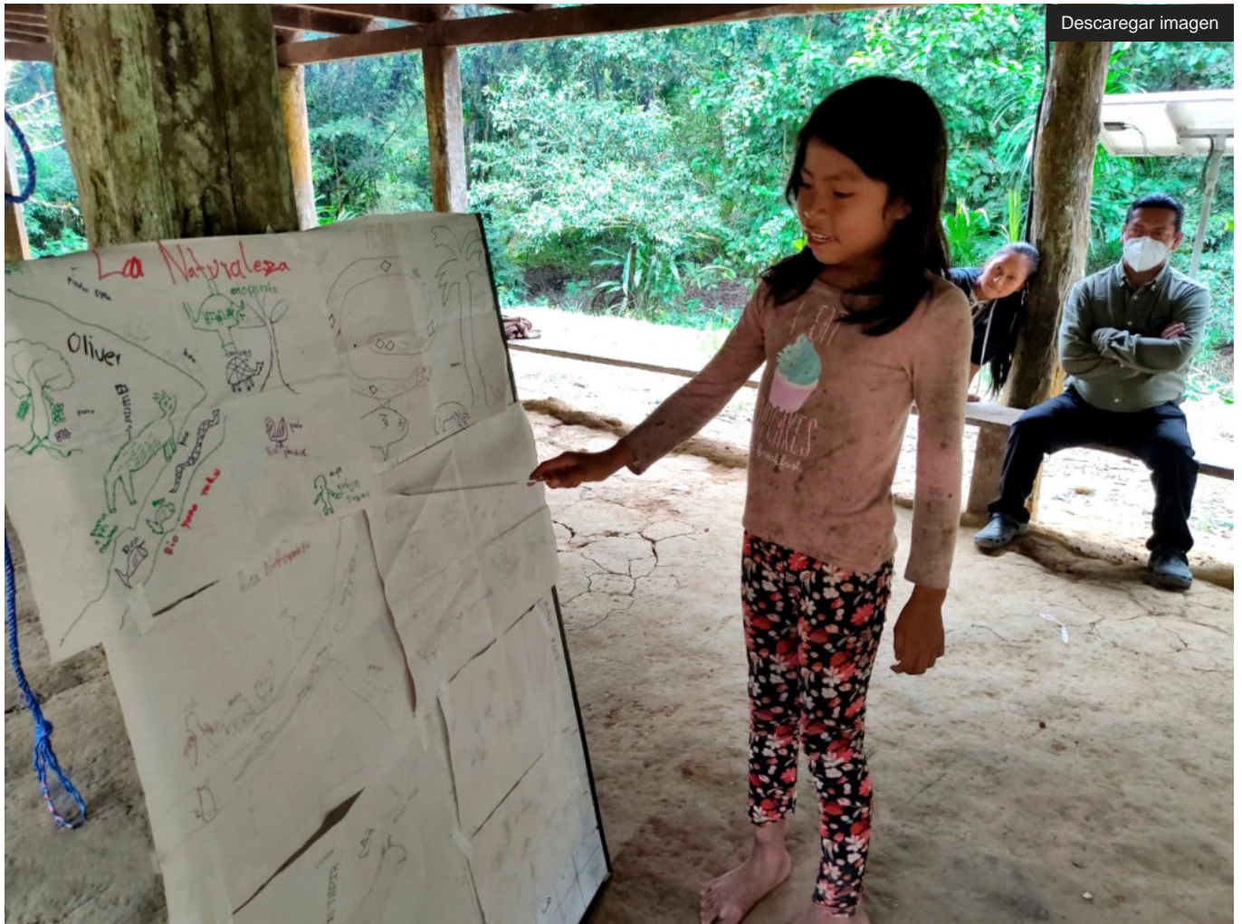
Nena kichwa expasant els seus coneixements sobre ecosistemes i biodiversitat al territori comunitari de Yana Yaku