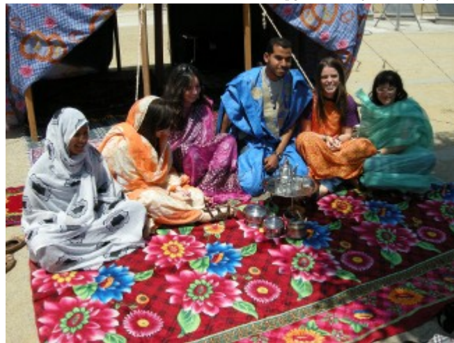
/export/sites/universitat-lleida/ca/serveis/c L'esplanada rere l'edifici polivalent va acollir la jornada solidària

Quina és la situació actual dels milers de persones que viuen als campaments de refugiats del Sàhara? Com és el seu dia a dia al desert després de més de tres dècades esperant un referèndum sobre el seu futur? Aquestes són les preguntes que vol respondre la jornada de conscienciació que tindrà lloc el proper 24 de maig al campus de Capponet de la Universitat de Lleida (UdL), darrere de l'Edifici Polivalent. Serà gràcies a una iniciativa de l' Oficina de Desenvolupament i Cooperació [ /sites/universitat-lleida/ca/serveis/ODEC/ ] de la UdL, la Coordinadora d'ONGD i altres Moviments Solidaris de Lleida [ http://www.coordinadora-ongd-lleida.cat/ ], Sàhara Ponent [ http://www.saharaponent.org/ ] i la Paeria.