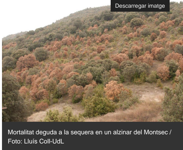
Mortalitat deguda a la sequera en un alzinar del Montsec

http://blog.creaf.cat/coneixement/que-son-els-serveis-ecosistemics/ ] (beneficis ambientals com ara l'absorció de carboni o la biodiversitat) que aporten els boscos. Així ho afirma una recerca on han participat experts de la Universitat de Lleida (UdL), el Centre de Ciència i Tecnologia Forestal de Catalunya (CTFC) i el CREAL que s'acaba de publicar a la revista científica Global Change Biology [ https://onlinelibrary.wiley.com/journal/13652486 ]. L'article forma part d'un estudi sobre escalfament global a la Mediterrània, impulsat per l'equip del projecte MedECC [ https://www.medecc.org/ ], que vol complementar els informes periòdics del Panell Intergovernamental de Canvi Climàtic [ https://www.ipcc.ch/ ] (IPCC).