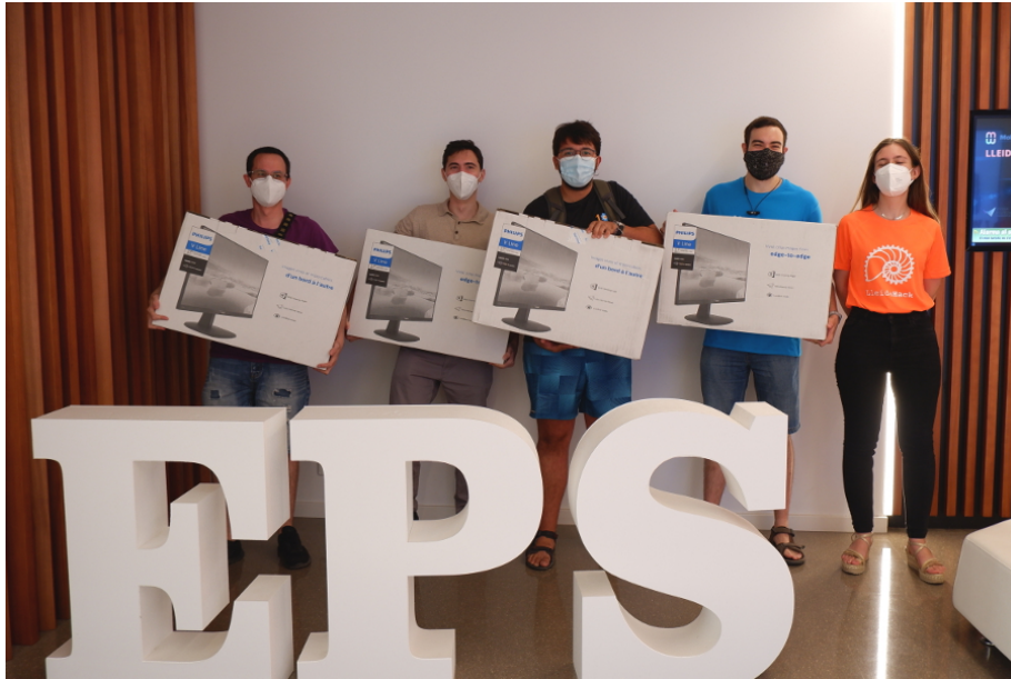
Els guanyadors de l'Hackató, amb els premis

Cambrà de Comerç de Lleida, Associació d'Empreses de Tecnologies i Serveis de la Informació- AETI i i2CAT Àrea 5G Ponent.