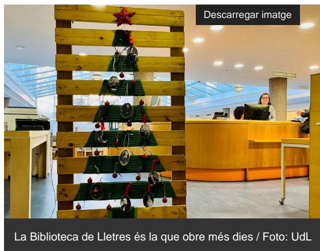
La Biblioteca de Lletres és la que obre més dies

La Universitat de Lleida (UdL) tanca les seues portes al públic durant setze dies aquest Nadal -del 24 de desembre al 8 de gener, ambdós inclosos- per estalviar uns 81.500 euros (57.000€ en energia, 23.000€ en neteja i 1.500€ en comunicacions). Es tracta d'una quantitat "sensiblement superior" a la dels darrers tancaments en aquest període, segons el vicerector d'Infraestructures de la UdL, Narciso Pastor, "per l'encariment de l'energia, especialment del gas". L'estalvi augmenta un 18'97% respecte al 2021.