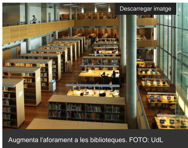
Augmenta l'aforament a les biblioteques.

La Universitat de Lleida (UdL) inicia aquest dilluns, 13 de setembre, el curs acadèmic 2021-2022, que arriba marcat per un augment de la docència presencial [